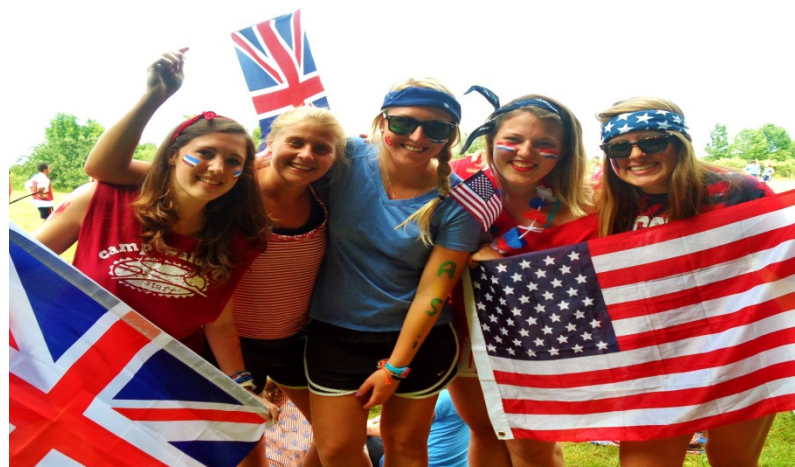
MAKE ENGLISH FRIENDS