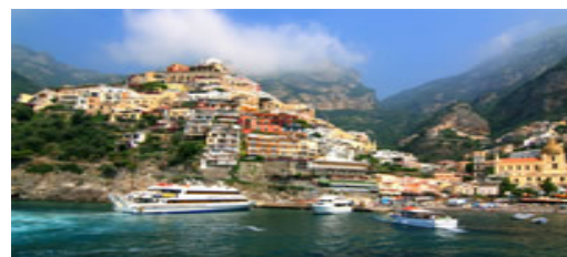
Positano e Amalfi

Per informazioni e prenotazioni mechel.presidente@fpsm.tn.it - tel. 3664078185