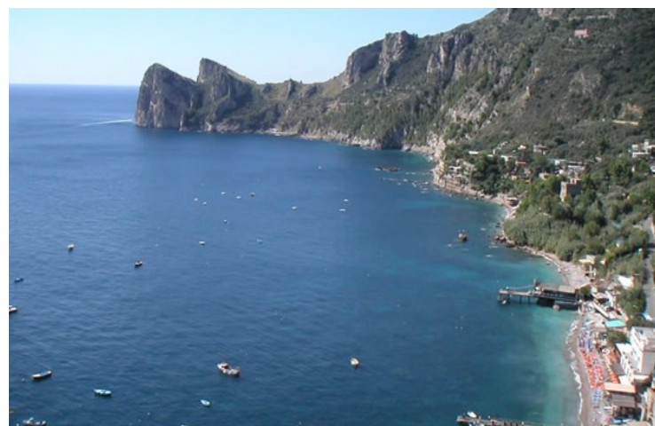
Posizione Villaggio Nettuno "IL VERDE SMERALDO CHE PARLA"

Al mare, in piscina, sulla motonave, nella reggia di Caserta, nelle riserve naturali o davanti al fuoco da campo alla sera – potete imparare l'inglese sempre e dappertutto – da noi al Villaggio Nettuno situato sul mare, tra la costa Amalfitana e la costiera Sorretina, al centro tra Capri, Sorrento e Positano, nella baia di Marina del Cantone – Nerano a pochi Km da Sorrento! Seguendo questo motto l'inglese non sarà parlato soltanto durante le lezioni mattutine, ma anche durante il tempo libero, le attività sportive e le attività serali. Insegnanti di madrelingua, dotati di esperienze di insegnamento a numerosi livelli e con qualifiche nel campo dei giochi didattici e la pedagogia all'aperto incoraggeranno ad usare l'inglese in ogni situazione. L'ascoltare ed il parlare lingue straniere tutto il giorno, combinato con attività divertenti e di gioco, e paesaggi mozzafiato, garantisce che questa settimana sarà un'esperienza indimenticabile!