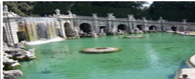
Reggia di Caserta