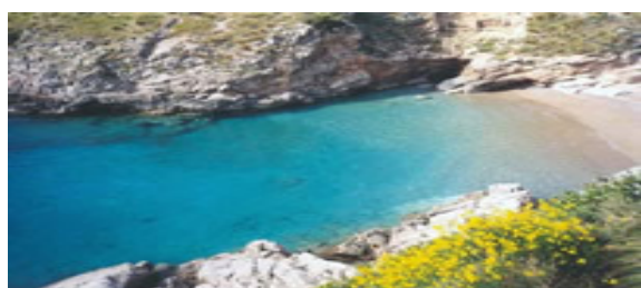
Baia di Ieranto

SABATO consegna diplomi - preparazione valigie partenza con Bus privato dal campeggio per Napoli con treno per rientro alla ore 15,25